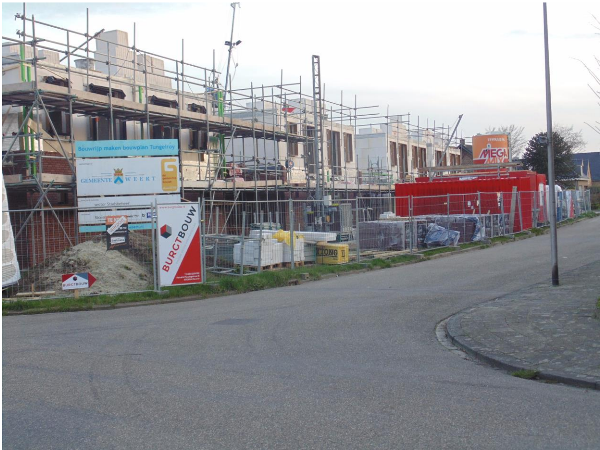
Situatie maart 2017 hoek Truppertstraat-Kerkveldweg

In 2016 begon men met de bouw van wat tegenwoordig Kumpehof en Hansehof wordt genoemd. Een nieuwe wijk in Tungelroy met woningen voor ieder wat wils.