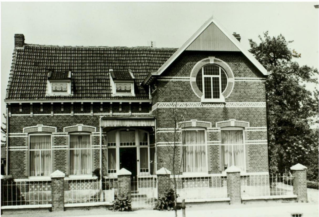
1982, GAW A06760