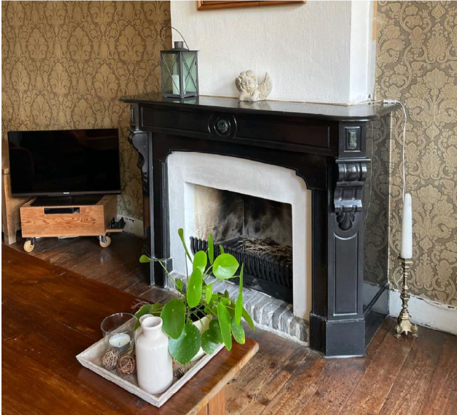
Authentieke marmeren nero Marquina-schouw