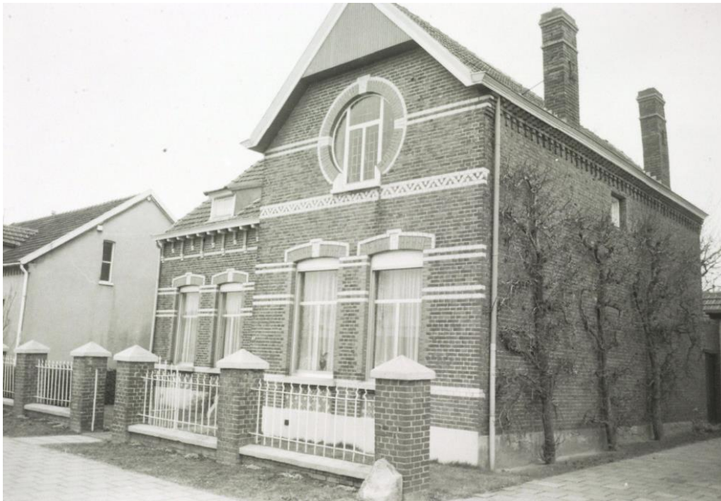
Pand in 1991

van de woning een diepe tuin. Beschrijving Tweelaags pand opgetrokken in een rood-paarse baksteen in een kruisverband onder een samengesteld zadeldak dat haaks op elkaar staat. De hoofdvorm van de grondslag is L-vormig. Met aan de achterzijde van het pand een oorspronkelijk vrijstaand eenlaags bijgebouw gedekt onder een zadeldak. Verbonden door een buiten deze bescherming vallende overkapping (serre) en muurdeel dat haaks staat op het hoofdgebouw. De asymmetrische voorgevel, gelegen op het zuiden, bestaat uit een tweetal raamkozijnen, rechts daarvan een ingangspartij en in het naar voren komende risaliet twee gelijke raamkozijnen van hetzelfde type als de linker twee. De voorgevel is gedecoreerd met horizontale (dubbele) banden van bakstenen met een roomwitte kleur, in terracotta kleurige bakstenen worden de zijflanken van de vensters benadrukt. Onder elk venster een trommelvlak met siermetselwerk met ruitpatroon; in vier verschillende kleurcombinaties afgewisseld in bakstenen in een roomwitte kleur, olijfgroen, terracotta en roodpaarse steen. Boven het kozijn een segmentboogvormige rollaag in terracottakleurige baksteen en in roomwitte baksteen uitgevoerde sluitsteen en omlijsting van de rollaag.