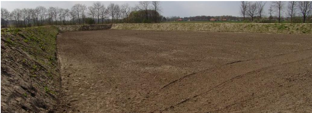
Schans van Ell, binnenplaats

Het gebruik van deze schansen was natuurlijk gereguleerd en iedere schansgemeenschap had haar eigen reglement. Aan het hoofd stonden twee schansmeesters (op sommige plaatsen ook wel gouverneurs geheten), die het toezicht hadden op het beheer van de schans. De weerbare mannen werden ingedeeld in rotten of groepen van 10 à 15 man, die elkaar moesten aflossen bij de wacht. Aan het hoofd van de wacht stonden de rotmeesters, die tevens als raadsleden fungeerden van de schansmeesters. Wacht houden was de voornaamste bezigheid op de schans. Vandaar ook, dat regelmatig de bewapening gekeurd werd, hoofdzakelijk bestaande uit schietroeren, pieken, riekken en seizen. Elke schansgenoot zorgde voor zijn eigen uitrusting. Als er gevaar dreigde, werd de hoorn geblazen en iedereen zorgde zo snel mogelijk met zijn kostbaarste bezittingen, ook het vee, op de schans te komen. De weerbare mannen grepen de wapenen en namen hun plaatsen in op de wallen. Niemand mocht schieten zonder uitdrukkelijk bevel van de rotmeesters. Een schans bood geen voldoende verdediging tegen een goed georganiseerd leger maar wel tegen de talrijke benden van plunderende en rovende soldaten.