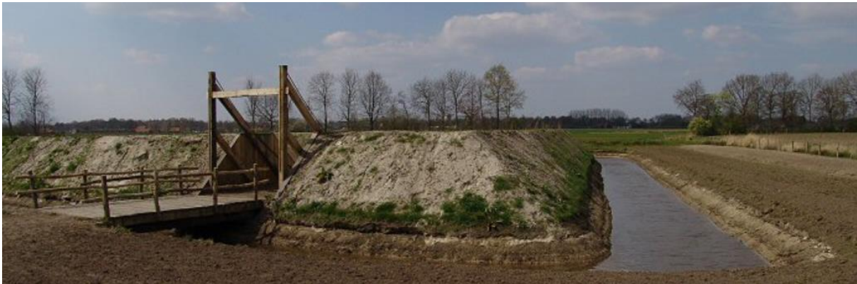
Schans van Ell met ophaalbrug

Wie een duidelijk beeld wilt krijgen van een schans moet zeker de Ellerschans bezoeken. Deze is gelegen tussen Swartbroek en Ell en is een archeologisch waardevol landschapselement.