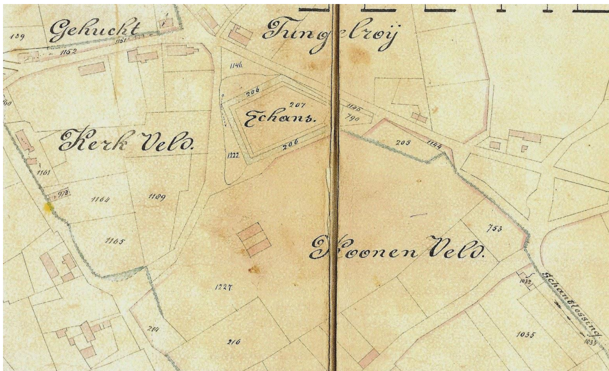
In het midden de Schans van Tungelroy op de zogenaamde Waterlossingskaart van 1903.

De Schans van Tungelroy moet ook tijdens de 80-jarige Oorlog gebouwd zijn. In 1647 wordt deze schans voor het eerst vermeld met de verkoop van het schanshuis. Pas in 1989 werd de laatste gracht gedempt. Op die plaats is het altijd heel moerassig geweest vanwege de gracht die om de schans lag. De Tungeler Schans had een oppervlakte van ongeveer 67 are en had een vijfhoekige plattegrond. De gracht die om de schans heen gebouwd was werd gevoed met het water uit de Tungelroyse Beek. De schans lag ook hoger dan de omliggende omgeving.