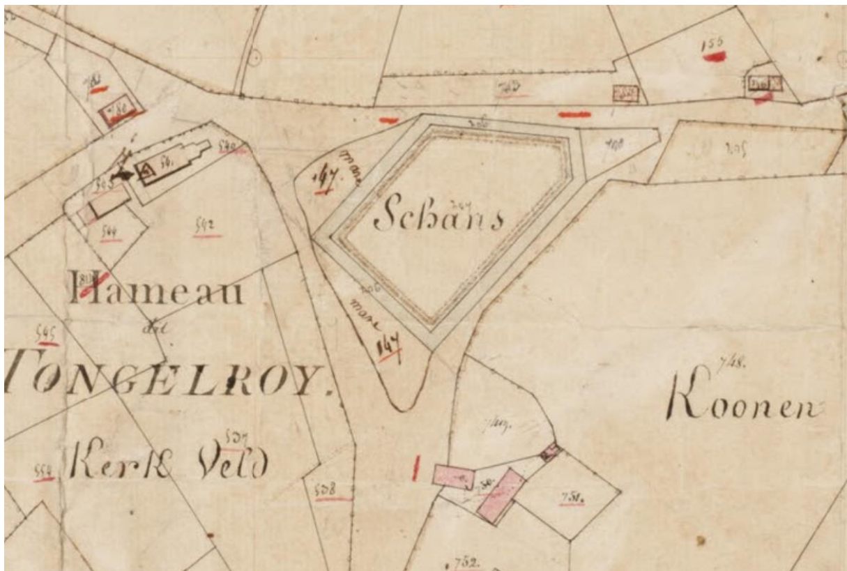
Tungeler Schans op kaart 1849. Links, boven de naam "Hameau" de kerk van Tungelroy

Deze schansen, waarvan er meerdere waren in de omgeving, werden veel gebruikt tijdens de 80-jarige oorlog (1566-1648). De boerenschans van Tungelroy was ook een schans die gebruikt werd tijdens de genoemde oorlog.