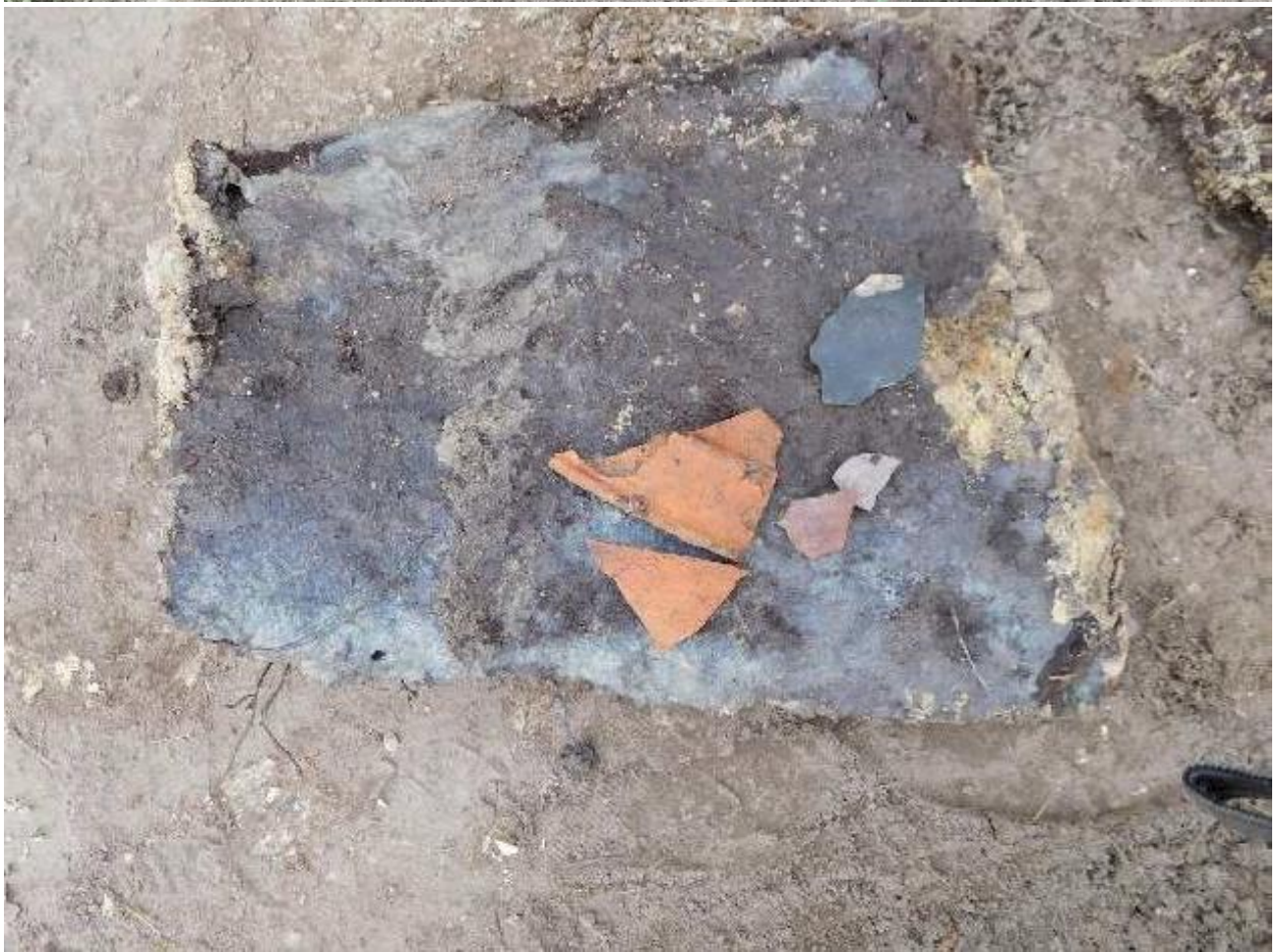
Boven: detail wigvormige turfplag en onder de aardewerk vondsten waarvan de datering plaatsvond op basis van Bergen op Zooms aardewerk van Gerrit Groendeweg (1992)