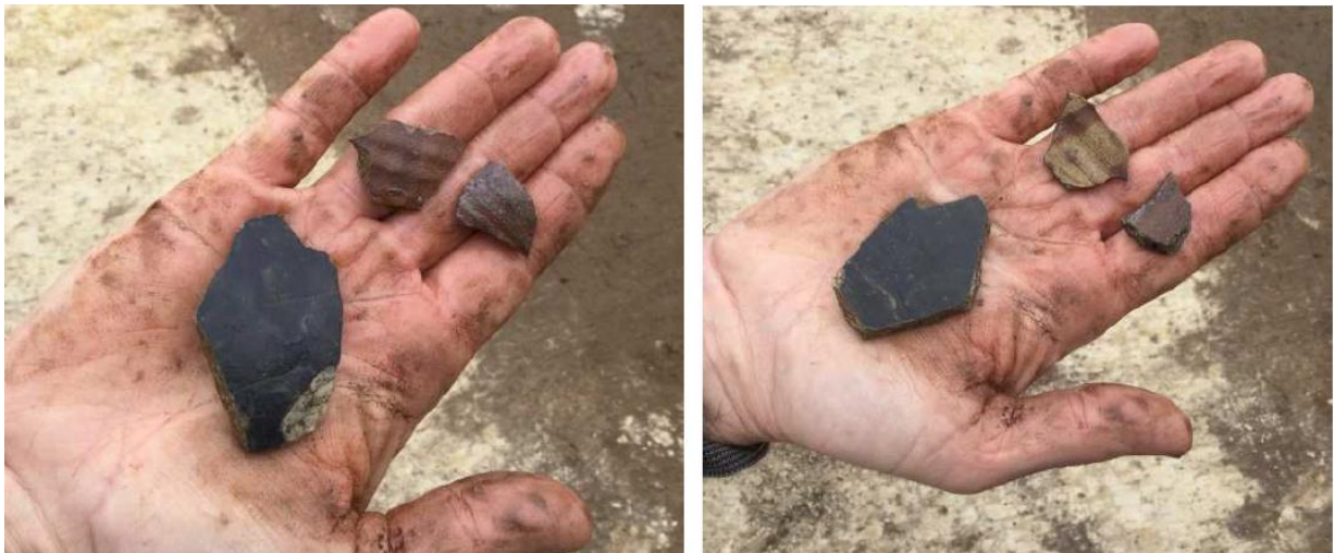
Grote fragment is van de Elmpter pot. Hieronder een voorbeeld van zo'n pot. 14 e eeuw.