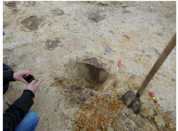
profielputje van een paalspoor

Ten noorden van de bewoningssporen is een complex van een 4-tal watergangen, welke mogelijk als erfafscheiding gediend hebben. Het betreft een brede watergang, direct grenzend aan de bewonerssporen, waarboven vrijwel evenwijdig daaraan twee smallere. Deze worden overkruist door een smalle loodrecht daarop staande watergang. Zie de foto hieronder.