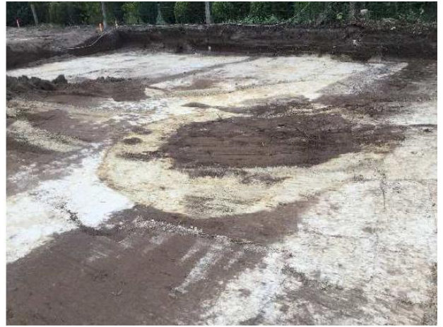
De contouren van de waterput zijn duidelijk zichtbaar.