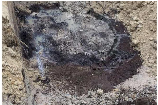
Links profieldoorsnede en rechts de basis van de opbouw van de put: plaggen