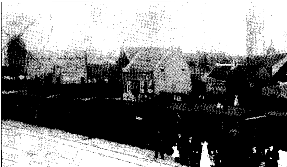
De tram op het station aan de Langpoort.

toebehorend woonhuis met tuin, bestemd tot kommiezenwoning, nabij grenspaal nr. 154. De huurprijs bedraagt f 150,- per jaar. Op 25 januari delen zij mede dat de uitgaven voor de tramlijn reeds meer dan f 165.000,- bedragen en dat aan het Rijk om uitbetaling van de derde termijn is gevraagd, en verzoeken het toegestane percentage vanwege de provincie uit te keren. 124