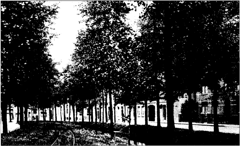
De tramlijn op de (huidige) Emmasingel.

annuïteitsbetaling. De gemeenteraad gaat vervolgens akkoord met het exploitatiecontract.