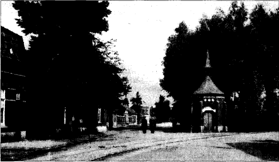
De tramlijn op de hoek Maaspoort-Maaseikerweg.