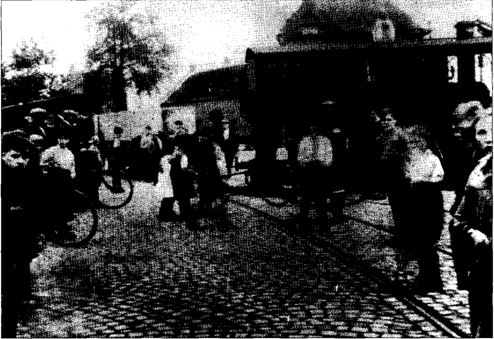
Een ontspoorde tram.