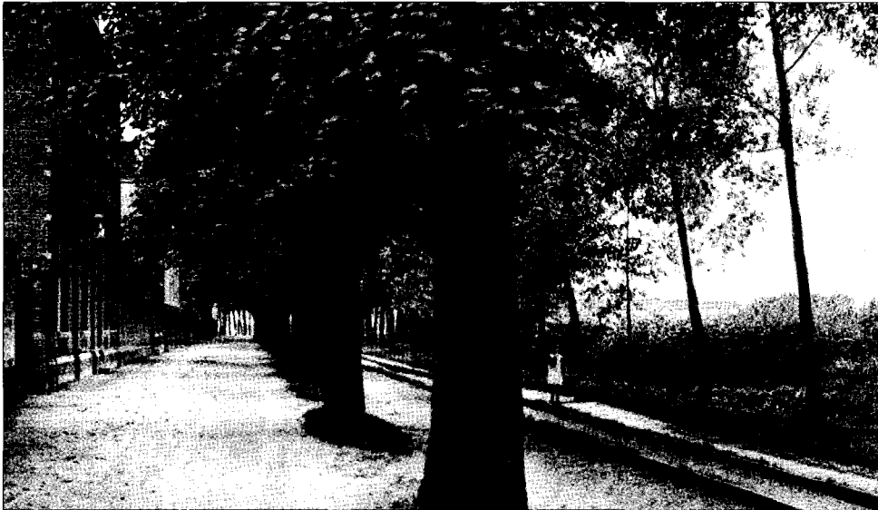
De tramlijn op de St. Jozefswal (nu Wilhelminasingel).

km op Weerter gebied en 2,25 km op Stramproyer grondgebied. De Belgische spoorbreedte van 1 m wordt aangehouden. De kosten worden geraamd op afgerond BF 501.345: op Weerter grondgebied BF 380.964 en op Stramproyer territorium BF 120.381. Per km bedragen de kosten BF 53.317.