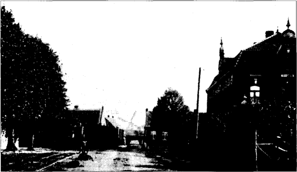
De tram in Stramproy.

Sinds 2 februari 1916 is er stagnatie in het tramverkeer. De Duitsers laten geen tram meer het land in of uit. Ook alle personen is het verboden en absoluut onmogelijk gemaakt de grens bij Stramproy te passeren. 138