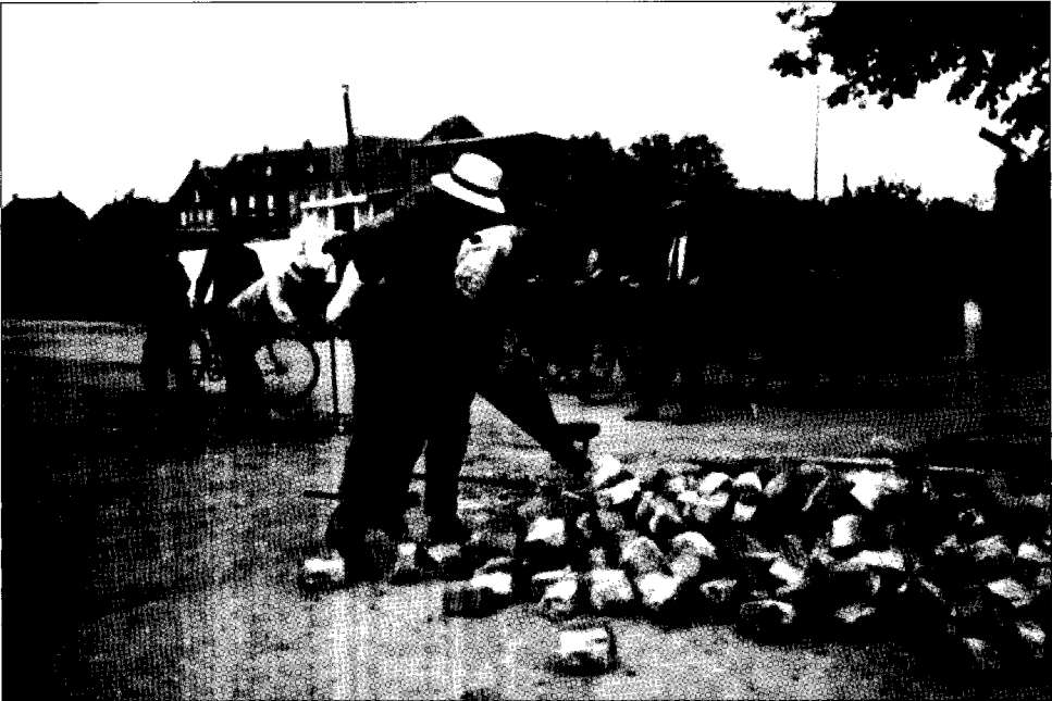
Het opbreken van de tramlijn in 1933.

het renteloos voorschot af te zien, de Staat aanspraak maakte op de baten van de opheffing van de tramweg. 177