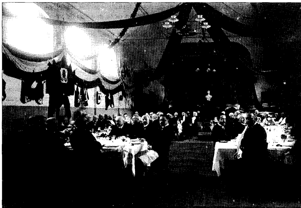
Banket in het Concertgebouw aan de Stationsstraat bij gelegenheid van de opening van de tramlijn.

Burgemeester en wethouders roepen op 31 januari de tussenkomst in van de gevolmachtigd minister van Nederland in Brussel bij de minister van Financiën van België, opdat deze de vrije doorvoer van boter en eieren van Weert en omgeving naar Maastricht via de buurtspoorweg Weert-Maaseik-Maastricht toestaat. Ook wil men dezelfde gunst voor de doorvoer van vee. 119